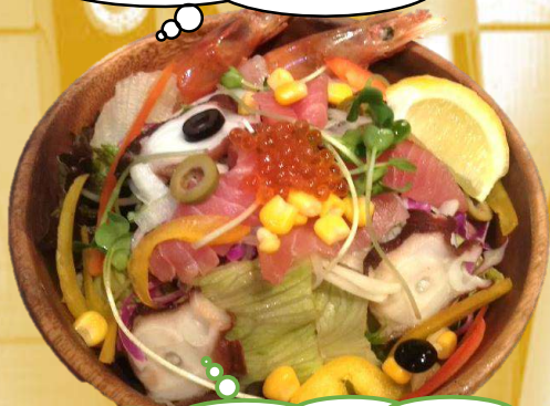
フィッシャーマンサラダ